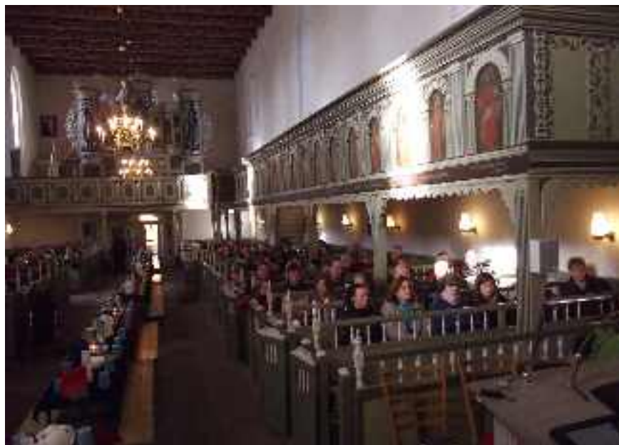
Taufgedächtnis - Andacht halten und zusammen Essen und Trinken in der St. Martinskirche

Am ersten Sonntag im November sind die Kinder ganz besonders eingeladen, die im Jahr 2008 durch die Taufe in die Kirche aufgenommen wurden. Wir feiern Taufgedächtnis. Familien, deren Kinder bei uns getauft wurden, bekommen vorher als Einladung eine große „Taufkerze“ aus Pappe, die von dem Täufling für diesen Gottesdienst bunt angemalt werden soll. Wer in gleichen Jahr sein Kind in einer anderen Kirche hat taufen lassen, ist eingeladen, sich rechtzeitig im Pfarramt zu melden (04463 444) und mit dabei zu sein. In diesem Festgottesdienst dreht sich alles um die Kinder und deren Erinnerung an die Taufe – und anschließend wird in der Kirche gemeinsam gefeiert.